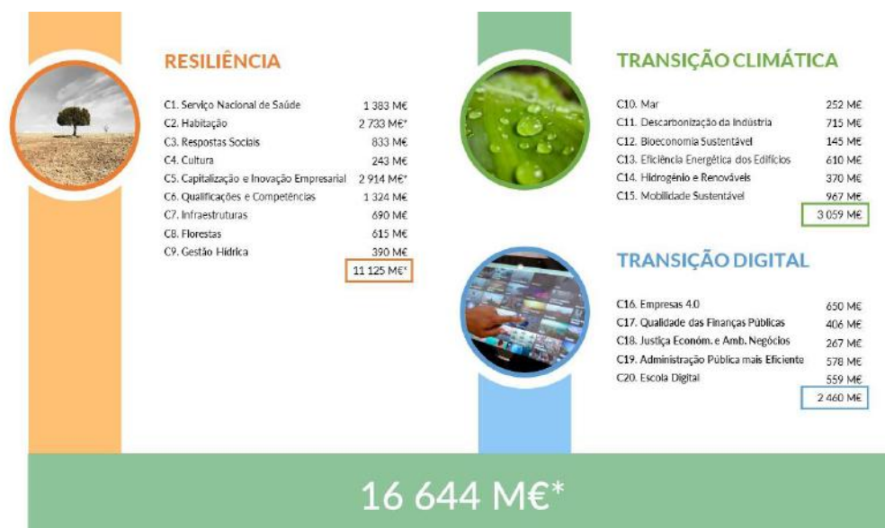
Figura 2. As Componentes do PRR e os Investimentos Associados

Nota: * Possibilidade de recurso adicional a empréstimos no valor até 2.300 M€ a solicitar à Comissão Europeia até 2022.