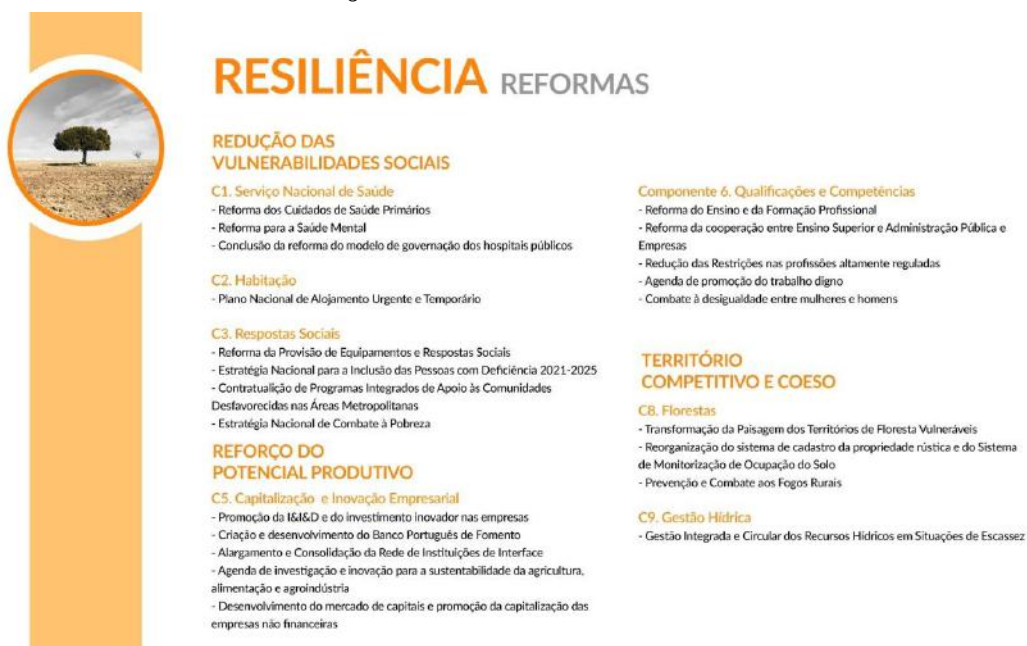
Figura 3. A caminho da Resiliência: Reformas

Estas prioridades contemplam o desenvolvimento de 9 componentes , num total de 49 investimentos que, em conjunto com as 22 reformas previstas , constituem um conjunto coerente e integrado de respostas de política pública aos desafios que o país enfrenta para reforçar a sua resiliência.